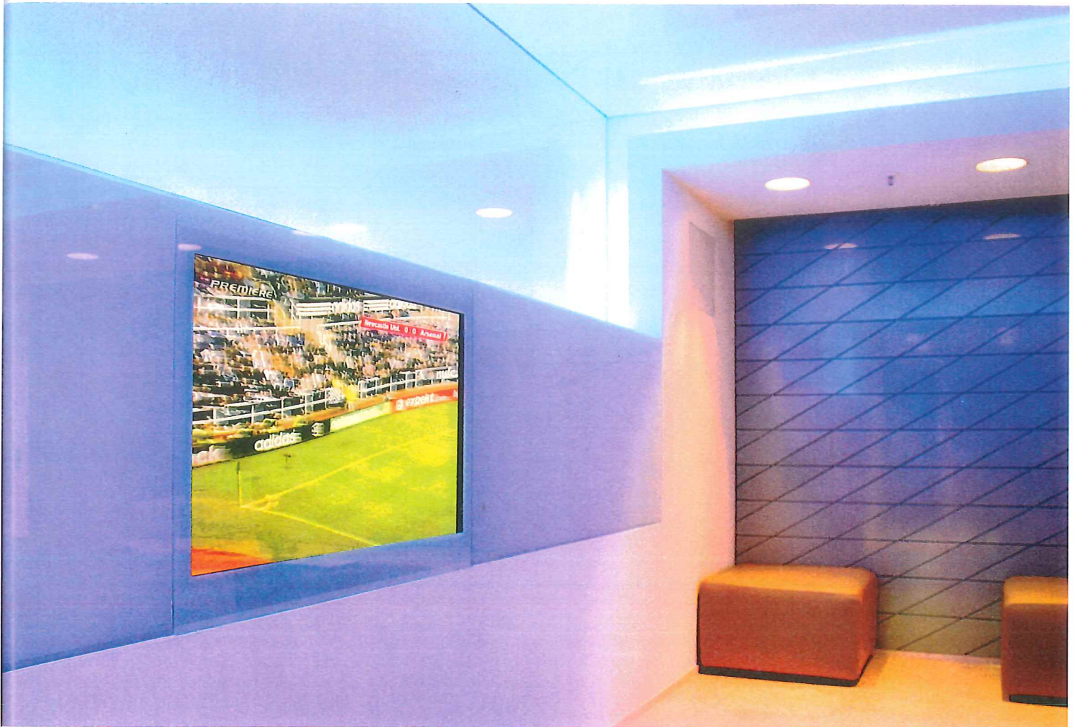
Das Flaggschiff: Allianz-Loge für 60 Personen. Komplette Medientechnik. Foliendecke: Barisol. Motiv an der Wand: Autolack. Licht: Erco, Neon Härter