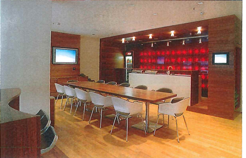
Oben links: Loge für 12 Personen, komplette Medientechnik. Wandverkleidung: europ. Nussbaum. Deckenlampen: Erco. Teppich: Carpet Concept, mit Travertinfliesen. Stühle: Walter Knoll