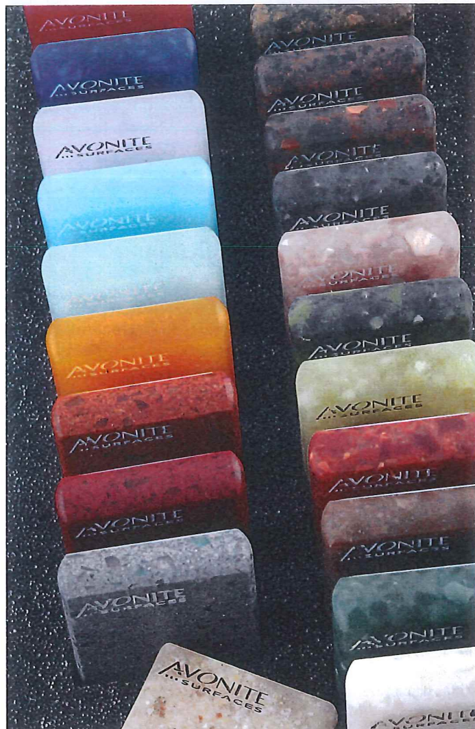
Avonite gibt es in zwei verschiedenen Varianten: Die Kollektion „Foundations“ wird auf Acrylharzbasis hergestellt, die „Studio Collection“ ist eine Kollektion auf Polyesterharzbasis